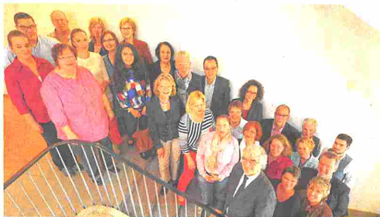
Trafen sich gestern in der VHS: Vertreter des Netzwerkes „Deutsch lernen in Essen“.

Was viele Essener nicht wüssten: „Die Chinesen stellen die größte Gruppe derer, die zu uns kommen. Die zweitgrößte Gruppe kommt aus Polen.“ Finanziert werden die Integrationskurse seit 2005 vom Bundesamt für Migration und Flüchtlinge,