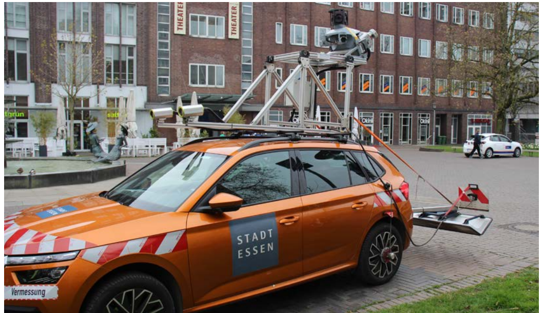
Auf Tour mit dem Spezialmessfahrzeug der Stadt Essen: Mit Kameras und Georadar Veränderungen von Straßen und ihren Nebenbereichen ober- wie unterirdisch fest im Blick.

die Wegstrecke und sorgen für eine noch höhere Genauigkeit der Daten (Foto: rechts).