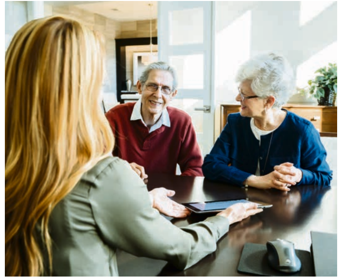
Die Stadt Essen bietet kostenlose Wohnberatungen für Ältere an, damit sie sich auf Dauer in der Wohnung wohl fühlen.

Im Schlafzimmer sei ihr Bett etwas erhöht worden und „mit der Aufstiegshilfe komme ich morgens viel besser aus dem Bett.“ Auch die