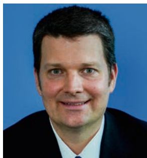
Vorsitzender der AFD-Fraktion: Dr. Hermann Postert.

Dieser Widerspruch wirft grundlegende Fragen auf, insbesondere zum Fortbestand des Gasnetzes, welches für eine echte Wahlfreiheit in allen Stadtteilen notwendig wäre. Da Wasserstoff für die Beheizung von Wohngebäuden vermutlich ausscheidet, bleibt die künftige Energiequelle in diesen Netzen ungewiss. Letztlich ist die Umsetzung des Plans mit immensen Kosten verbunden, die aufgrund der verschuldeten öffentlichen Haushalte voraussichtlich von den Bürgern und Steuerzahlern getragen werden müssen.