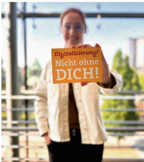
Am Digitaltag Essen 2026 informiert die Verwaltung über ihre Digitalisierung.

Ebenfalls vor Ort mit dabei sein werden das Jugendamt, der Fachbereich Schule, das Gesundheitsamt, das Umweltamt, das Standesamt und viele mehr.