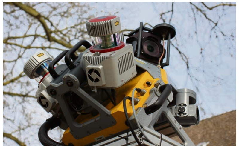
Die Kombination von Fotos und Millionen von Messpunkten ergibt dank Software ein gutes Bild von Veränderungen im sichtbaren Straßenbild.

Dann setzt er sich wieder hinter das Steuer. Es gibt rund 3.400 Straßen in der Stadt mit einer Gesamtlänge von über 1.500 Kilometern. Weitere Infos unter: www.essen.de .