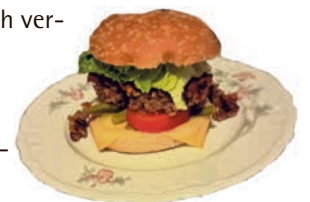
Vegane Burger sind eine gesunde Alternative.

Auch die Kartoffelecken (Rezept aus einem der vorherigen Newsletter) eignen sich dazu als gesunde Beilage.