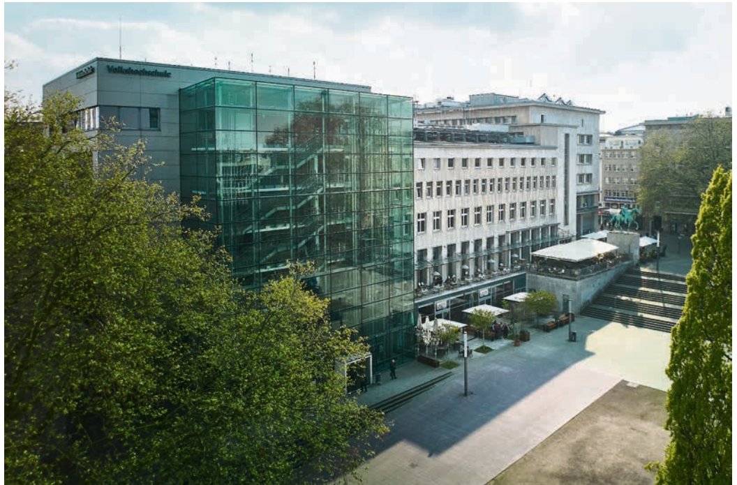
Beim Digitaltag 2026 in Essen die elektronische Möglichkeiten der Verwaltung zu erkunden: vom Antrag bis hin zum elektronischen Ausfüllen oder Herunterladen vom Dokumenten.