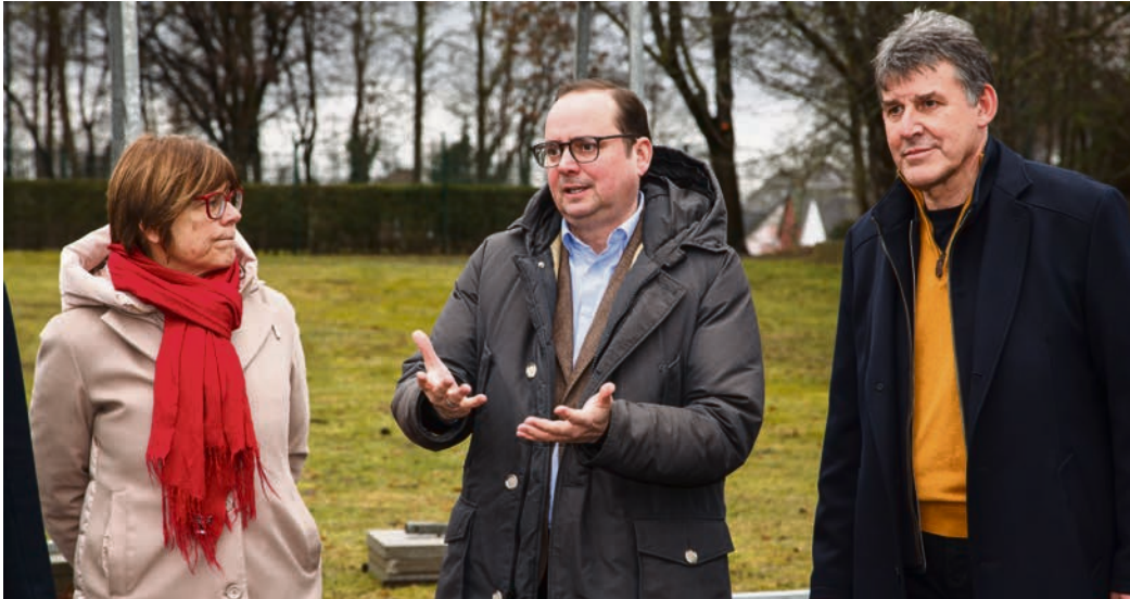
Die Bauarbeiten für den Emscherpark im Essener Norden haben begonnen. Bis zur Internationalen Gartenausstellung im kommenden Jahr entsteht ein multifunktionaler Park.