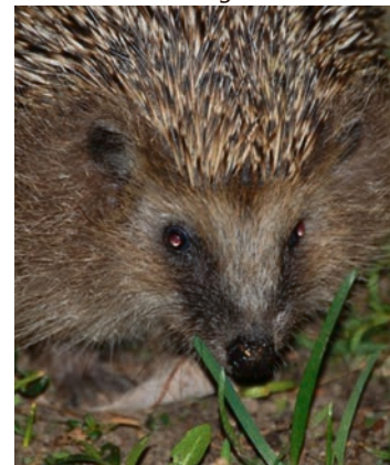
Igel und Amphibien sind nützliche Gartenhelfer.