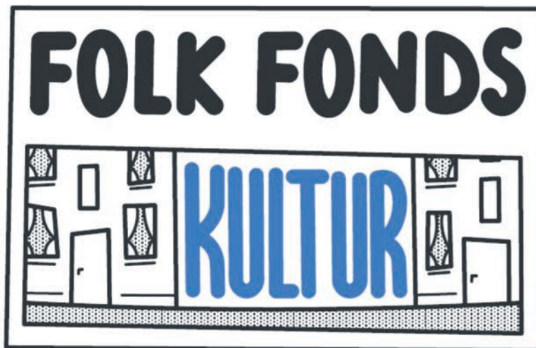
Die jugendliche Jury im Alter von 16 und 27 Jahren aus dem Bezirk VII wählen die besten Kulturprojekte aus.

Weitere Informationen sind unter: www.essen.de/folkfonds zu finden.