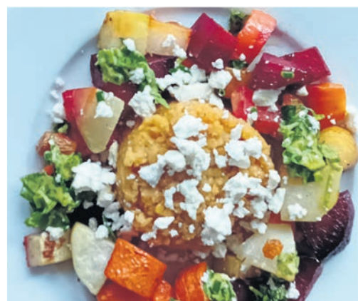
Der Linsensalat überzeugt durch seine Variationsmöglichkeiten.

Dazu passen: Joghurt- oder Senf-Dip, geröstete Sonnenblumen- oder Kürbiskerne, Topping aus Feta oder Ziegenkäse oder auch Vollkorn- oder Sauerteigbrot.