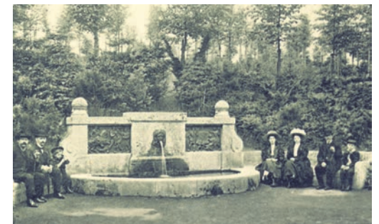
Der Schillerbrunnen im Stadtwald entstand 1905 zum 100. Todestag des Dichters.