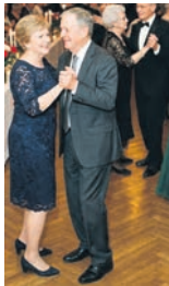
Tanzen in der VHS.

Am Freitag, 26. Juni, ab 19 Uhr lädt die VHS Essen, Burgplatz 1, zum Tanzball für Gesellschaftstanz ein. Der Sommerball der Gesellschaftstanzkurse von Stefanie Drensek ist offen für alle interessierten Tänzerinnen und Tänzer. Es gibt keinen Dresscode, aber um Kleidung von „mehr als Jeans und Turnschuhe“ bis hin zum festlichen Outfit wird gebeten. Wer tanzt, braucht eine gute Grundlage: Interessierte bringen sich daher etwas zu trinken und eine Kleinigkeit zum Essen mit. Einlass ist ab 18:30 Uhr. Der Eintritt beträgt 5 Euro pro Person. Anmeldung sowie weitere Informationen unter: www.vhs-essen.de (Kursnummer 261.2H135G).