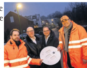
Essen setzt auf LED in Straßenlaternen.

Im Rahmen der Umrüstungsmaßnahme sollen rund 13.500 Straßenleuchten durch den Einbau der Module modernisiert werden. Das spart rund 63 Prozent des jährlichen Energieverbrauchs dieser Leuchten ein: In Summe rund 1.600.000 Kilowattstunden pro Jahr. Weitere Infos unter: www.essen.de .