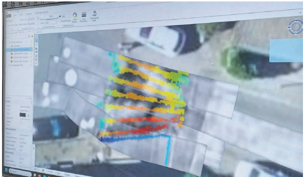
Mit dem Georadar entdecken die Essener Geophysiker frühzeitig Schäden unter Straßen, Bodenflächen oder an Gebäuden. Sie erkennen auch, ob Spannglieder in Brücken in Ordnung sind. Die farbigen Bereiche zeigen den Stahl, der in unterschiedlichen Tiefen verbaut ist.

Gebaut zwischen 1842 und 1844, nutzen es die Gläu-