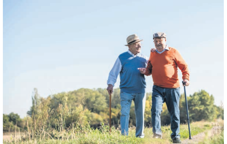
Das Programmheft zur Woche der Senioren vom 15. bis 21. Juni listet alle Veranstaltungen auf. Es liegt an öffentlichen Stellen aus.

Livemusik, kühle Getränke und leckeres Essen – der Feierabendplausch lädt dazu ein, den Tag in geselliger Runde im Grugapark ausklingen zu lassen. Zusätzlich gibt es einen Kreativ-