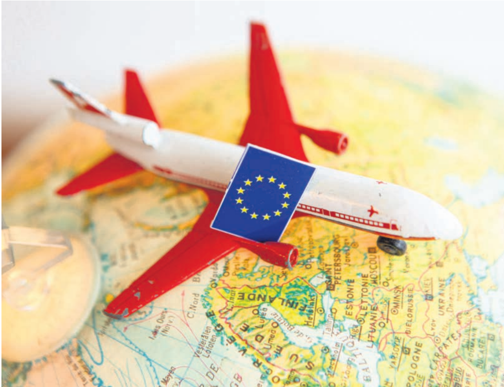
Der Rat der Gemeinden Regionen Europas/Deutsche Sektion vertritt seit 1955 die Interessen von über 800 Mitgliedkommunen und Kommunalverbänden mit einer Stimme in Europa.