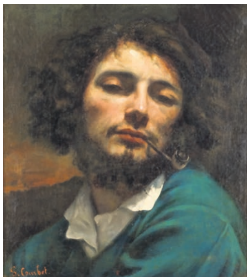
Gustave Courbet, „L'Homme à la pipe“ um 1849.

Per Mail: info@museum-folkwang.essen.de oder Telefon: 0201 88-45444 ist das Besucherbüro erreichbar. Geöffnet ist Di.–So.: 10–18 Uhr, Do. und Fr.: 10–20 Uhr. Montags bleibt die Ausstellung geschlossen.