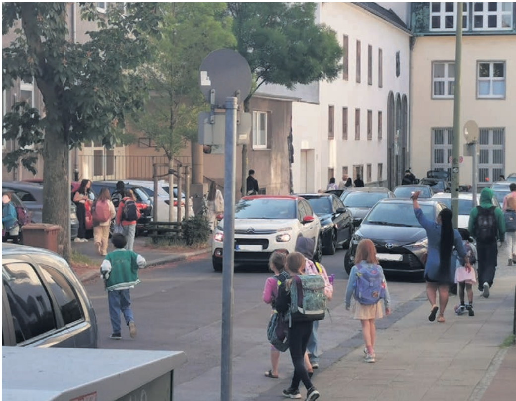
Dichter Verkehr und viele Schulkinder: Gerade zum Unterrichtsbeginn herrscht vor Schulen ein Verkehrschao, wie einst auch vor der Bardelebenstraße, die zur ersten Schulstraße in Essen wurde.

Sicheren Schrittes erreichen auch die Kinder der Kantschule in Katernberg ihre Schule. Dort wird werktags die Straße Büchelsloh morgens ebenfalls zwischen 7:30 Uhr und 8:30 Uhr für die Elterntaxis gesperrt. Die Hol- und Bringzone liegt in Katernberg an der Straße Dortmannhof. Nach dem Ausstieg erreichen die