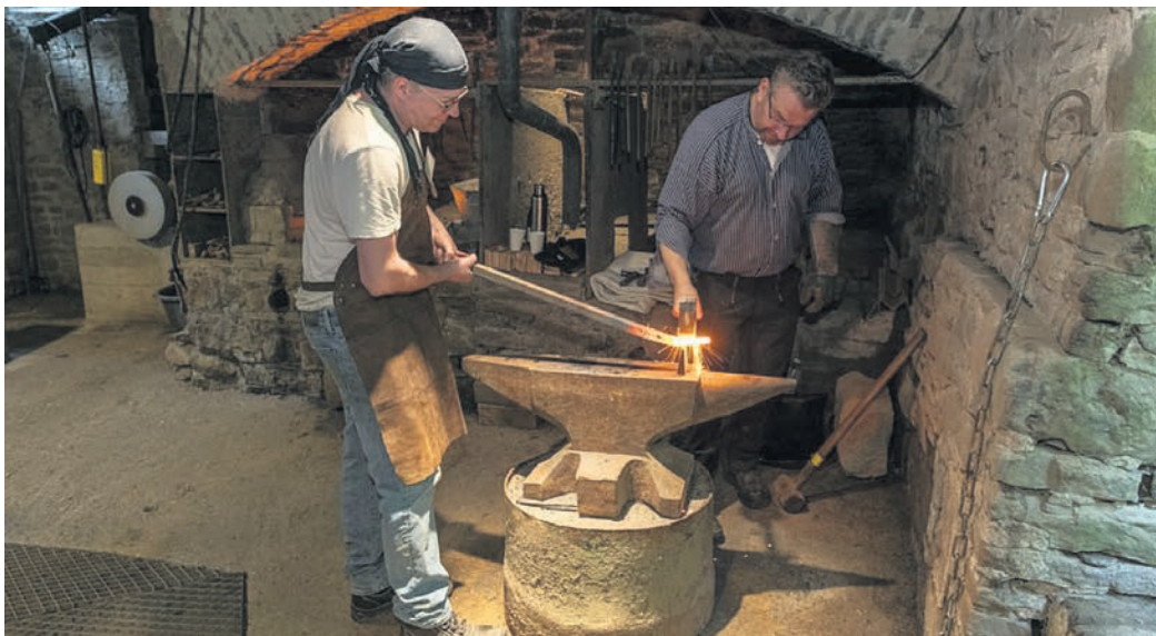
Die Schmiede erläutern während ihrer öffentlichen Vorführungen die Funktionsweise des Aufwerfhammers. Einst wurde dort landwirtschaftliches Gerät produziert.