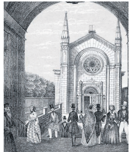
Der Neue Israelitische Tempel folgte in der Bauweise der jüdischen Zahlensymbolik.

Aus der Kombination der Daten von Georadar und Laserscan-Vermessung ergibt sich, dass unter der Apsis vermutlich der Grundstein liegt, verborgen hinter einer zugemau-