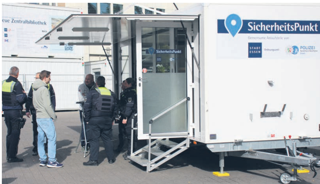
Der mobile SicherheitsPunkt von Polizei und dem Essener Ordnungsamt kommt bei der Bevölkerung gut an. Viele Menschen nutzen ihn, um Fragen zu stellen oder um auf Sicherheitsmängel hinzuweisen.