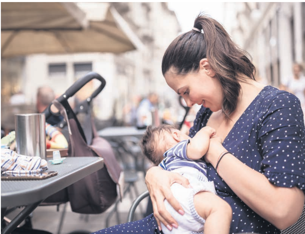
Die Stadt Essen sucht Orte, an denen Mütter mit Babys und Kleinkindern willkommen sind, um in einer ruhigen Umgebung zu stillen.

Institutionen, die noch mitmachen möchten, können sich unter: familienportal@jugendamt.essen.de melden.