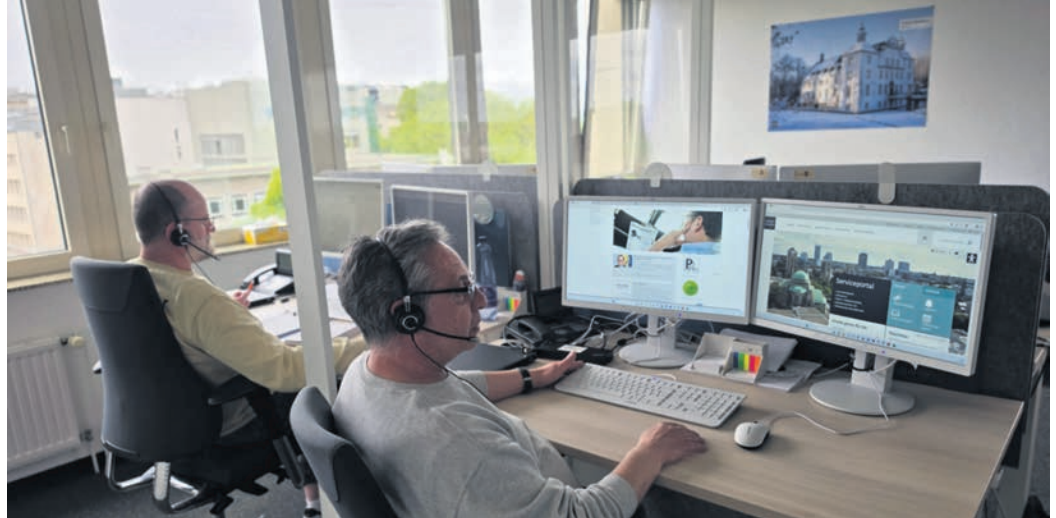
Das ServiceCenter der Stadt Essen steht mit seinem 43-köpfigen Team als erster Ansprechpartner für alle Fragen rund um die Verwaltung zur Verfügung.

Der telefonische Bürger- und Terminvereinbarungsservice des ServiceCenters (SCE) der Stadt Essen besteht aus 43 Mitarbeitenden, die Bürgerinnen und Bürger telefonisch Auskunft geben und beraten. Sie sind in unterschiedlichen Schichten von Montag bis Freitag zwischen 7:30 und 18 Uhr erreichbar. Zu den angebundenen Hotlines zählen die Behördennummer 115 sowie die Hotline zur Terminvereinbarung bei der Ausländerbehörde, den Bürgerämtern, Ukraine, der Fahrerlaubnisbehörde, der Kfz-Zulassungsstelle, der Wohngeldstelle, der Anmel-