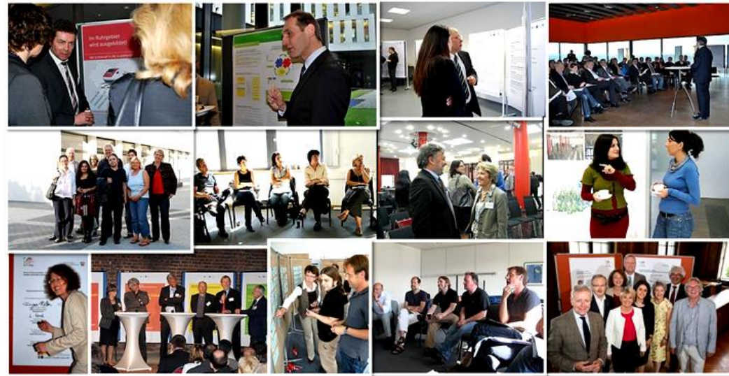
Impressionen aus der langjährigen Zusammenarbeit.

Als Initiative der städtischen Integrationsressorts startete 2008 die Städtekooperation mit dem Ziel, einen Beitrag zur Zukunftsfähigkeit der Region Metropole Ruhr zu leisten und nach dem Prinzip „gemeinsame Lösungen für gemeinsame Anforderungen“ zu handeln. Im Blickpunkt steht die Entwicklung gemeinsamer Zukunftsbilder, Vorgehensweisen und praktischer Handreichungen im Umgang mit der Vielfältigkeit der Menschen in der Region und der darin liegenden Chance. Durch die Bündelung von Kompetenzen und Expertise, durch Erfahrungsaustausch und Erfahrungstransfer sollen Synergien und Innovationspotenziale und eine höhere Durchschlagskraft entstehen.