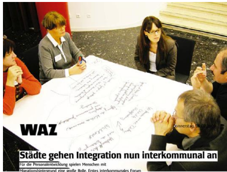
Interkommunales Forum 2009