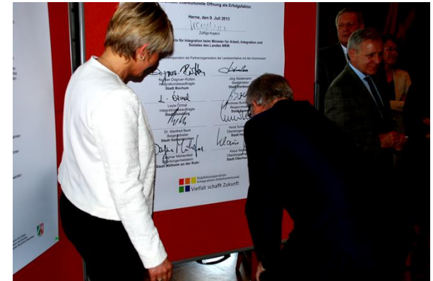
Beitritt zur Landesinitiative im Herner Rathaus 2013