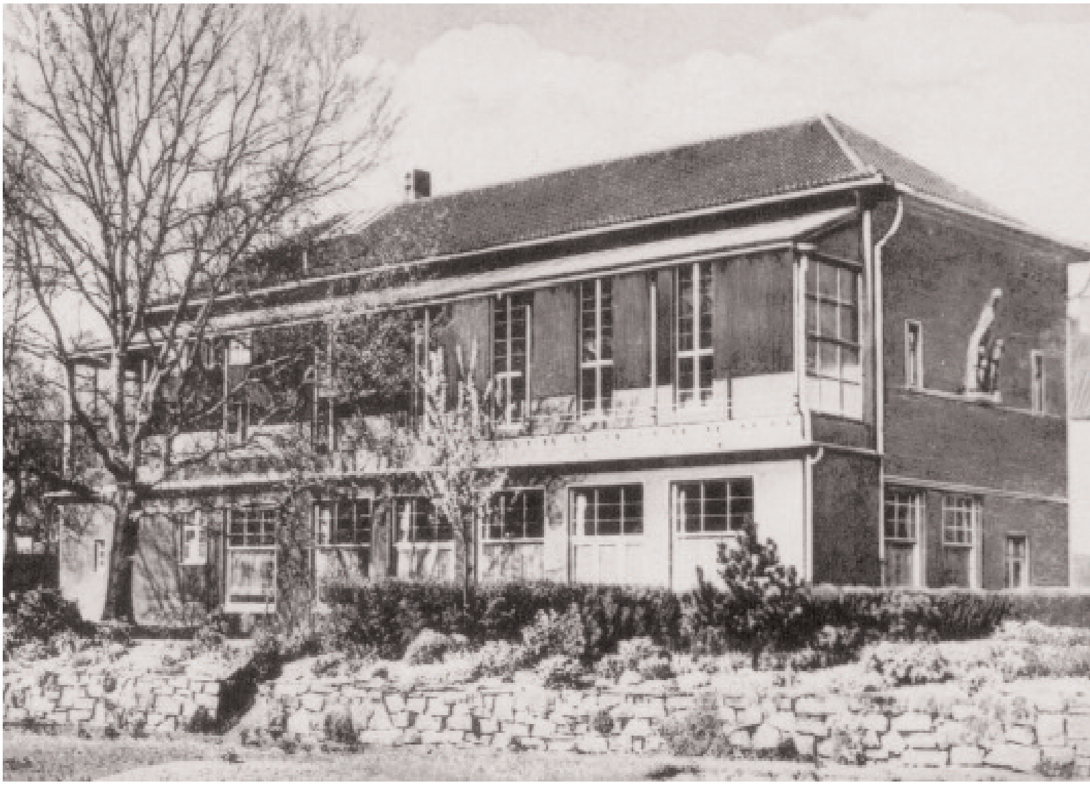
Der alte Marien - Kindergarten