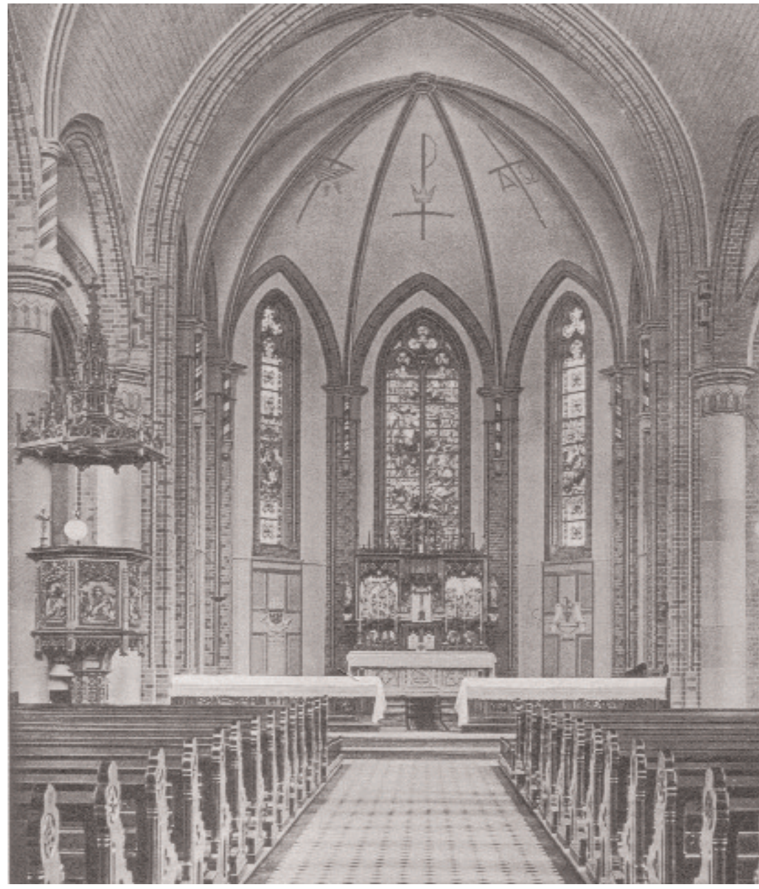
Der ehemalige Chor der St. Josef Kirche