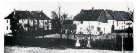
Gesamtansicht von Westen