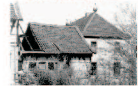
Auch die Scheune bedurfte noch einer gründlichen Überholung