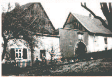
Toreinfahrt mit dem alten Torhaus links. Das Haus wurde für einen Neubau abgerissen.