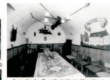
Ausgebauter Gewölbekeller im Haupthaus.