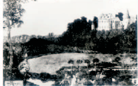
Das Gemälde aus dem Jahre 1739 zeigt das Rittergut von Osten aus gesehen.