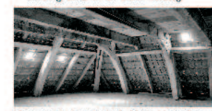
Krummsäulendachstuhl im Haupthaus