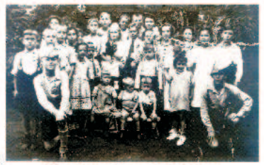
Kinder auf Haus Heisingen