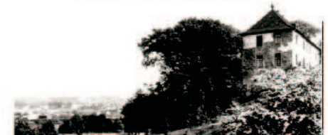
Das Haus von Norden aus gesehen. Das Bild zeigt die dringende Renovierung.