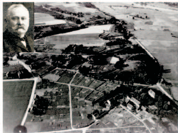
Auf der Luftaufnahme von 1926 erkennt man den strategisch gut gewählten Standort des Hauses, der für die Beobachtung des nördlichen Ruhrtals zur Zeit um 800 außerordentlich wichtig war.