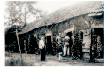
Stallungen kurz vor dem Abbruch