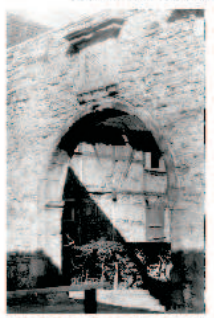
Toreinfahrt. Darüber das Wappen des Abtes Benedikt