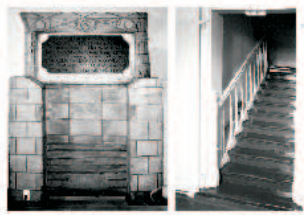
Kamin mit Inschrift