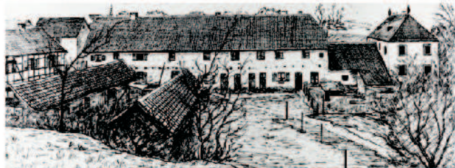
Vorburg, Wirtschaftsgebäude, Stallungen