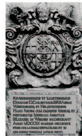
Wappen des Abtes Coelestin über dem Eingang zum Haupthaus

DER SEHR EHRWÜRDIG UND HERRLICHGEZEICHNETE HERR COELESTINUS DER SAIGERLICHEN UND REICHSUNTERLEHNBAREN FÜRSTEN STIFTES WERDEN UND HEILIGSTEN ABT. HAT DISES SCHLOS MIT ALLEN RECHTEN UND ZUGEHÖREN SELBSTHERRLICHES IN LINDENBURG ERWERBET IM JAHRE 1190 UND DAZU GELASSEN VOR ALTEM VERFALLEN IN EINE BESSERE GESTALT BRINGEN LASSEN.