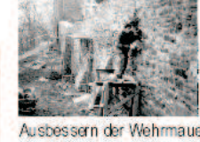
Ausbessern der Wehrmauer.