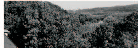
Blick vom Dachboden auf das nördliche Ruhrtal.