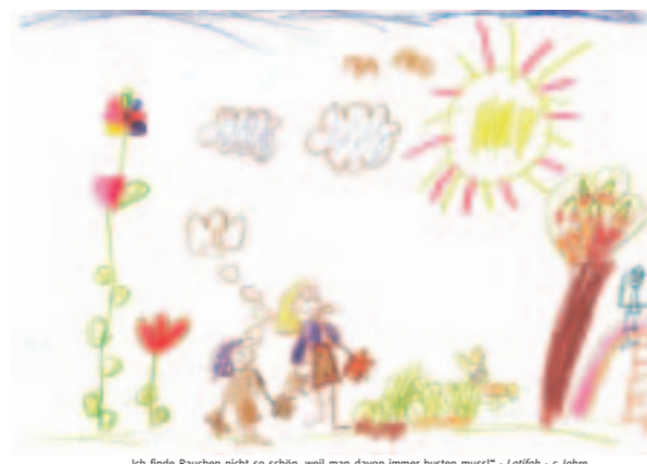
„Ich finde Rauchen nicht so schön, weil man davon immer husten muss!“ - Latifah - 5 Jahre Mir zuliebe rauchfrei