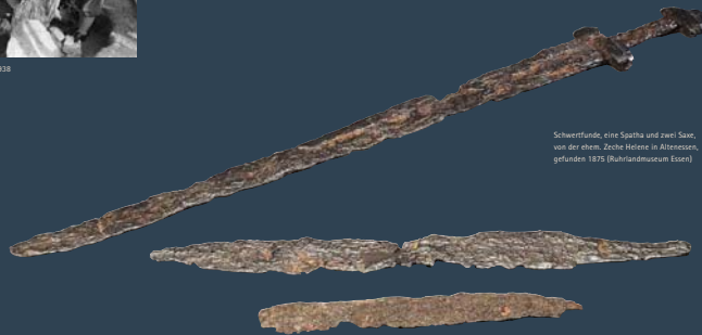
Schwertfunde, eine Spatha und zwei Saxe, von der ehem. Zeche Helene in Altenessen, gefunden 1875 (Ruhrlandmuseum Essen)