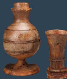
Holzbecher und Holzflasche, 16. Jahrhundert, Bodenfunde aus dem Burgplatzbereich (Ruhrlandmuseum Essen)