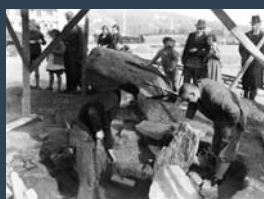
Ausgrabung der Steinkiste in Kupferdreh, 1938