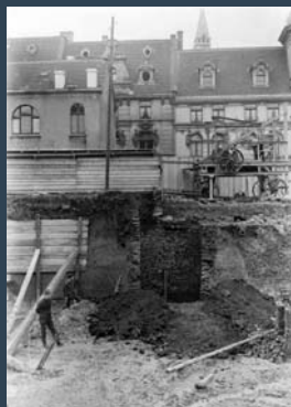
»Runder Turm« (mittelalterliche Kloak) in der Baugrube nördlich Burdeker in der Essener Innenstadt, 1925