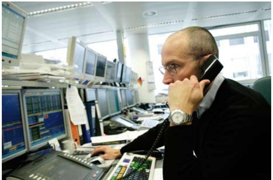
IT für den Energiehandel: Die in Essen ansässige RWE Supply & Trading GmbH – ein führender europäischer Energiehändler – setzt auf eine leistungsfähige und hochwertige Informationstechnologie. ▲

Essen ist Energiestandort Nr. 1 in Deutschland und Europa. Global Player wie RWE, E.ON Ruhrgas oder Evonik haben hier ihren Hauptsitz. Davon profitieren die IT-Unternehmen vor Ort. Denn für Energieunternehmen spielen moderne, qualitativ hochwertige IT-Systeme und IT-Dienstleistungen – insbesondere im Zuge der Liberalisierung der Energieversorgung – eine zunehmend wichtige Rolle, um auf wandelnde Herausforderungen der Märkte flexibel zu reagieren und sich im internationalen Wettbewerb erfolgreich zu behaupten. Daher setzen Unternehmen der Energiewirtschaft bei Analyse,