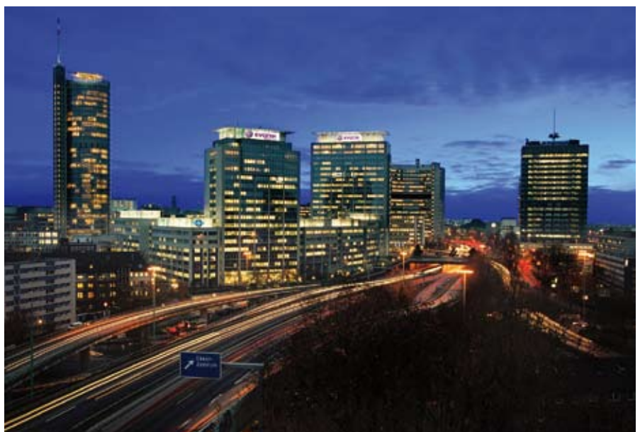
Essen ist Wirtschafts-, Handels- und Dienstleistungsmetropole. ▲

Weitere Superlative: Essen zählt zu den grünsten Städten Deutschlands und ist laut polizeilicher Kriminalstatistik 2007 auch eine der sichersten Großstädte in NRW. Das alles zeigt, dass Essen attraktiv ist – für die Bevölkerung, aber auch für die am Standort ansässigen Unternehmen und die, die es noch werden wollen.