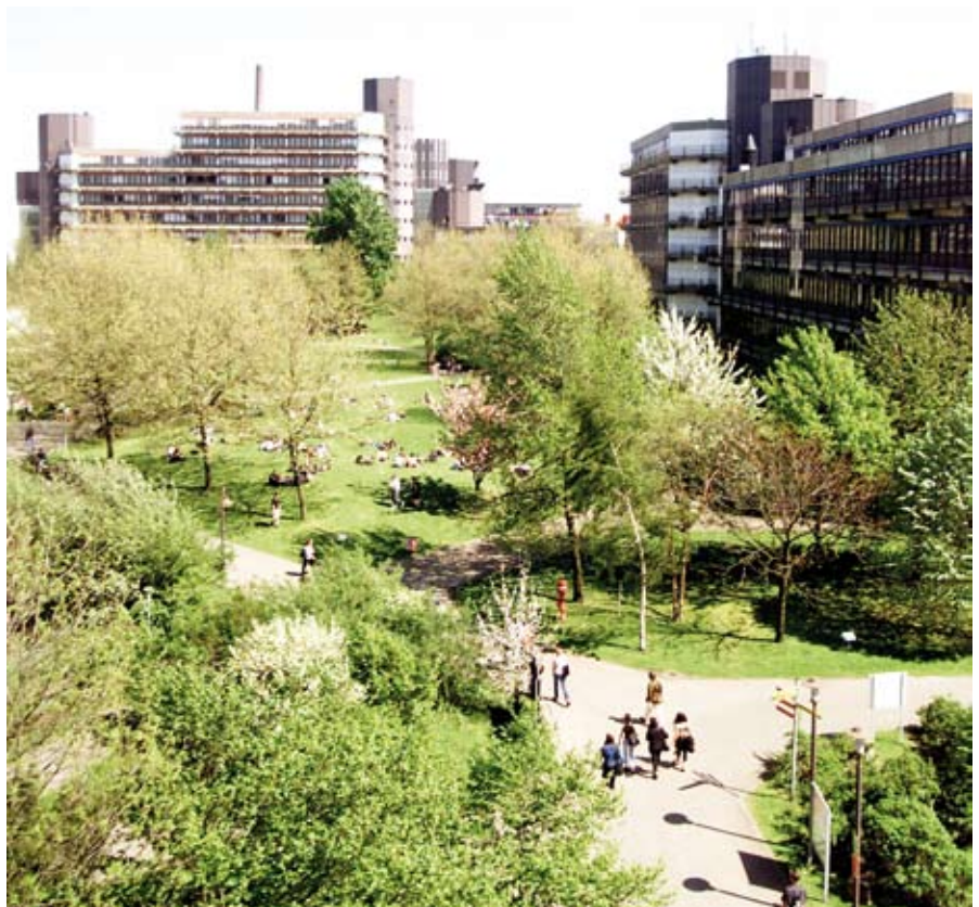
Am Campus Essen bietet die Universität Duisburg-Essen unterschiedliche Wissens- und Forschungsgebiete, die für die IT-Branche von besonderem Interesse sind. ▲

Die Universität Duisburg-Essen, die mit über 30.000 Studierenden zu den zehn größten deutschen Universitäten gehört, bietet auf dem Campus Essen verschiedene Bachelor- und Master-Studiengänge im Themenfeld IT an. Mit den Studiengängen „Angewandte Informatik - Systems Engineering“ und „Wirt-