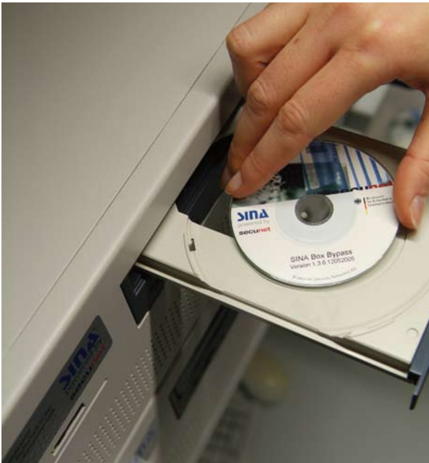
Die secunet Security Networks AG entwickelte gemeinsam mit dem Bundesamt für Sicherheit in der Informationstechnik (BSI) die „Sichere Inter-Netzwerk Architektur“, kurz SINA. SINA ermöglicht die geschützte Bearbeitung, Speicherung und Übermittlung von vertraulichen Informationen über das Internet. ▲

Biometrie, Authentifizierung und digitalen Signaturen auch Sicherheitsberatung und -management. Auf der Referenzliste stehen die Mehrheit der DAX 30-Unternehmen, führende internationale Konzerne, mittelständische Unternehmen sowie zahlreiche staatliche Bedarfsträger. So setzt unter anderem das Bundesverteidigungsministerium seit langem auf IT-Sicherheitslösungen von secunet.