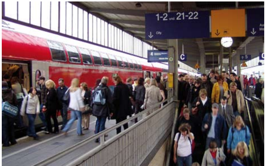
Essen ist Arbeitsmarktzentrum: Über 100.000 Einpendler kommen täglich in die Stadt. ▲

In der Essener Wirtschaft arbeiten die meisten Hochschulabsolventen im Revier, das Angebot