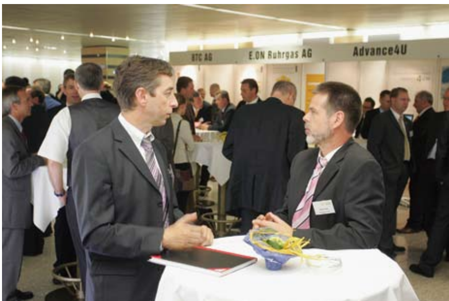
Veranstaltungen wie die „IT-Trends“ sind eine ideale Möglichkeit für den kommunikativen Austausch und die aktive Netzwerkarbeit. ▲

Das Forum „IT-Standort Essen“ ist ein Zusammenschluss von Essener IT-Unternehmen und der Universität Duisburg-Essen mit dem Ziel, den Wissenstransfer zwischen Wissenschaft und Wirtschaft zu erleichtern, um so die am Standort Essen verfügbaren Potenziale im IT-Bereich besser ausschöpfen zu können. „networker-essen“ ist eins von sechs Regionalforen des ruhrgebietsweiten IT-Netzwerks „ruhr networker e.V.“, das mit knapp 200 Mitgliedsunternehmen aus dem Bereich IT, Medien und Kommunikation das mitgliederstärkste IT-Netzwerk in Nordrhein-Westfalen ist.