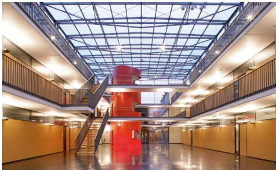
Das ComIn in Essen bietet eine große Anzahl flexibel gestaltbarer Büroflächen – insbesondere für die IT-Branche. ▲

Ein innovatives und zukunftsorientiertes IT-Unternehmen braucht als Ausgangspunkt