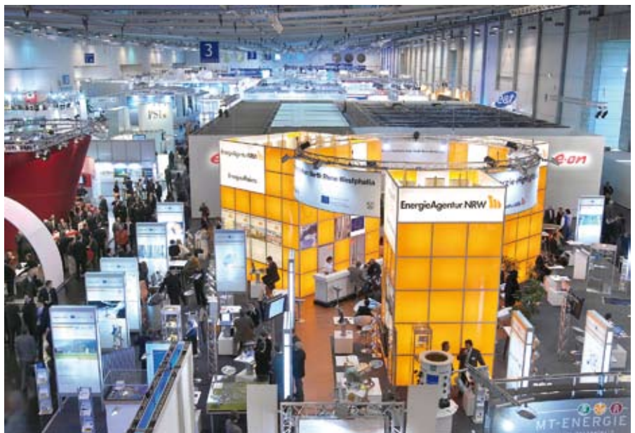
Die internationale Fachmesse „E-world energy & water“, Treffpunkt der Energie- und Wasserwirtschaft in der Messe Essen, bietet IT-Unternehmen eine hervorragende Plattform zur Präsentation ihrer Portfolios. ▲

herstellerunabhängig, nutzenorientiert und kostenbewusst umgesetzt werden. Mit ihren Tätigkeitsschwerpunkten Consulting, System- und Prozessanalyse sowie Softwareentwicklung bietet die SOPTIM AG ein umfassendes