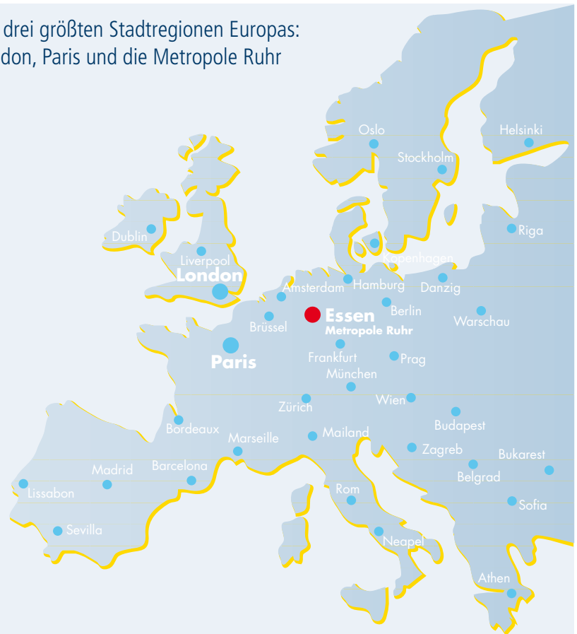
Die drei größten Stadtregionen Europas: London, Paris und die Metropole Ruhr