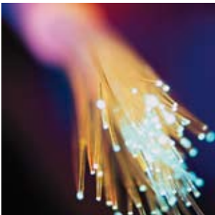
Informations- und Kommunikationswirtschaft