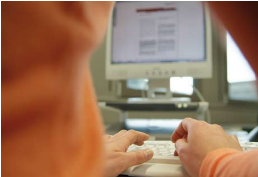
Moderne Software- und Technologielösungen sind die Basis für erfolgreiches unternehmerisches Handeln. ▲

Essen ist ein führender IT-Standort in der Metropolregion Ruhr. Mit über 600 Unternehmen und mehr als 12.000 Beschäftigten ist der Bereich der Informationstechnologie eine Kernkompetenz der Konzernstadt Essen. Nach einer Studie des Bremer BAW Institut für Wirtschaftsforschung GmbH belegt Essen bei der Spezialisierung der EDV- und Softwarebranche im nationalen Vergleich der Großstädte den 5. Platz. Der Anteil der in der IT-Branche tätigen Personen ist in Essen doppelt so hoch wie im bundesweiten Durchschnitt. Essen liegt damit vor anderen Großstädten wie Hamburg, Köln, Düsseldorf oder Berlin.