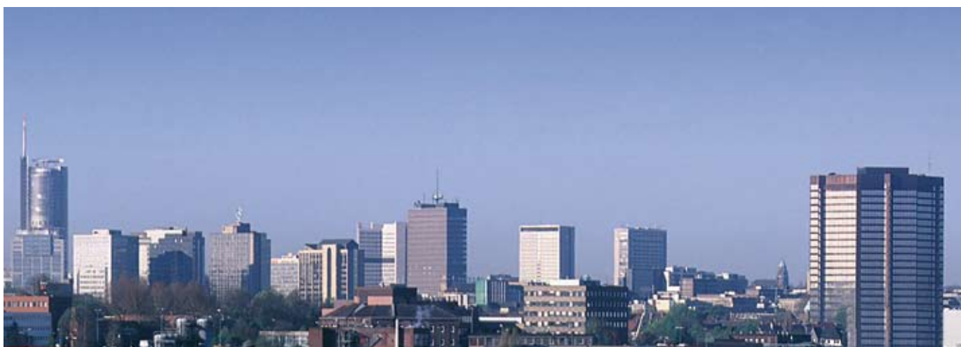
Die Essener Skyline mit den Konzernzentralen der großen deutschen Unternehmen ist Synonym für die Wirtschaftskraft der Region. ▲

sind für die Wahl ihres Unternehmenssitzes. Neben der zentralen Lage in der Metropole Ruhr und damit dem problemlosen Zugriff auf das enorme Kunden-, Absatz- und Arbeitskräftepotenzial – rund 5,3 Millionen Menschen leben im Ruhrgebiet – weist Essen Standortvorteile auf, die durch qualitatives Weiterentwickeln bereits vorhandener Strukturen über die Jahre gewachsen sind. Dazu gehören unter anderem die direkten Zugriffsmöglichkeiten auf aktuelle Forschungsergebnisse und hochqualifiziertes Personal sowie hervorragend ausgebaute Netzwerke in