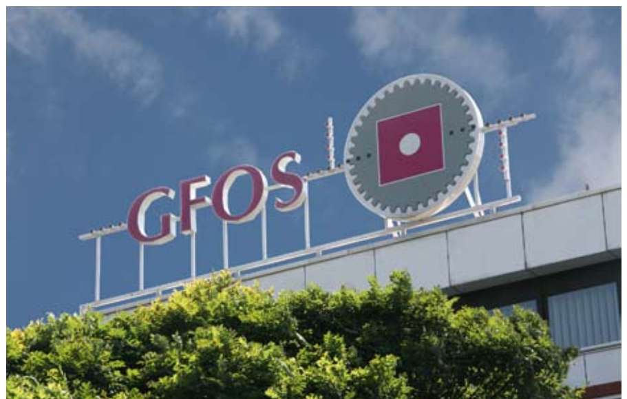
20 Jahre IT-Erfahrung aus Essen: Als branchenübergreifendes Softwareunternehmen bietet die GfOS Gesellschaft für Organisationsberatung und Softwareentwicklung mbH Zeit-, Betriebs- und Personaldatenlösungen. ▲

Für zahlreiche international tätige „IT-Großen“ ist Essen ein wichtiger Standort: Siemens, Atos Origin, T-Systems, MEDION und viele andere. Sie haben sich mit ihren Dienst-