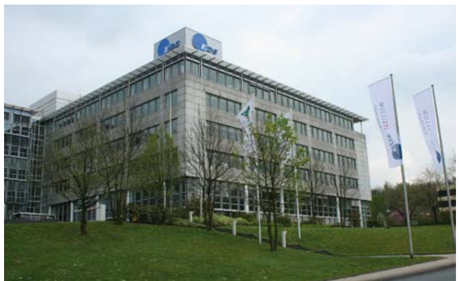
Dienstleister für praxiserprobte und zukunftssichere IT-Lösungen im Handel: EDS Itellium mit Sitz in Essen-Bredeneu. ▲

Unternehmen als „Trust Provider“, indem es Qualifizierungsziele wie Wirtschaftlichkeit, Ordnungsmäßigkeit, Konformität, Qualität und Sicherheit nachweist.