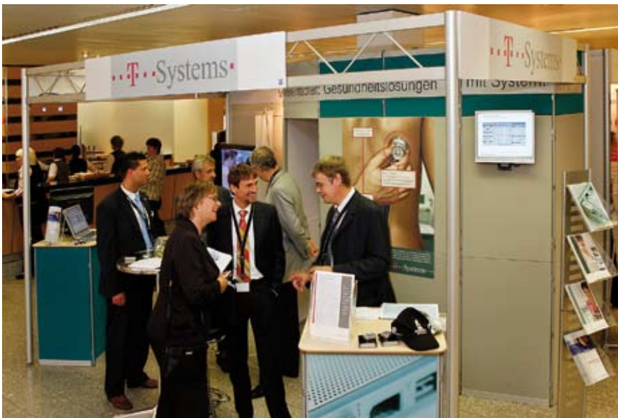
Die Begleitausstellungen der „IT-Trends“ dienen als Bühne für IT-Unternehmen und als idealer Treffpunkt für die Teilnehmer der Fachkongresse und der Fachforen. ▲

So verbindet der Fachkongress IT-Trends „Energie“ aktuelle Anforderungen der Energiewirtschaft mit neuen Entwicklungen im Bereich der Informationstechnologie. Konzipiert als branchenübergreifende Informationsbörse und fachspezifisches Diskussionsforum mit Begleitausstellung stellt der Fachkongress die ideale Möglichkeit für IT-Unternehmen dar, sich über die neuesten Entwicklungen zu informieren, mit Entscheidern der NRW-Energiewirtschaft und der öffentlichen Verwaltung an einem Tisch zu sitzen und darüber hinaus sich und ihre Dienstleistungen und Produkte zielgerichtet zu präsentieren.