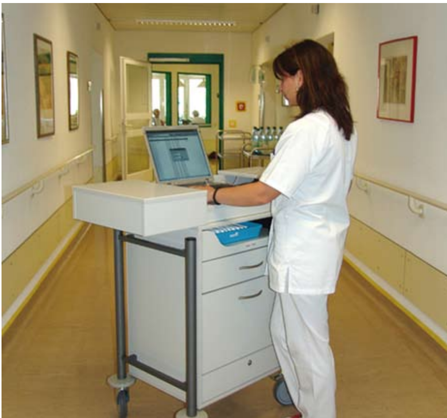
Wenn der Computer mit zum Patienten geht: Gemeinsam mit Krankenhäusern in ganz Deutschland hat der Essener IT-Dienstleister März Internetwork Services AG das System „März-Hosp.IT mobil“ entwickelt. Es ermöglicht eine mobile, digitale und zugleich praxisingerechte Datenerfassung und -verarbeitung direkt am Patientenbett. ▲

Die opta data Gruppe mit Sitz in Essen trägt mit einem umfangreichen Dienstleistungsangebot und individuellen Produkten zur Optimierung der Unternehmensprozesse und zur Verbesserung der Wirtschaftlichkeit ihrer Kunden bei. Das seit fast 40 Jahren in Familientradition stehende Unternehmen bietet neben einem Abrechnungsservice auch innovative Branchensoftware, individuelle Qualitätsmanagement-Systeme und professionelles Marketing. Schon mehr als 20.000 Kunden aus der Gesundheitsbranche bauen auf diese individuell abgestimmten IT-Lösungen der opta data.